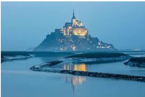
Abbildung 3 Mont Saint-Michel

Die offizielle Prüfung im DELF B2 oder C1 ist freiwillig und individuell. Es gibt auch keine obligatorischen Hausaufgaben oder Prüfungen im Unterricht.