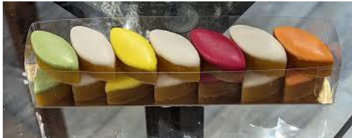
Abbildung 5 Calissons d'Aix