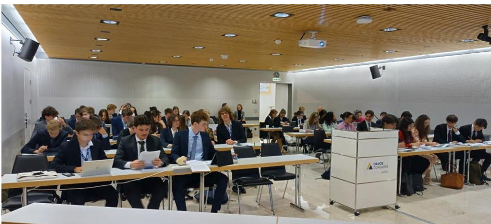
EEYP Davos 2023 im Kongresszentrum