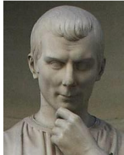
Niccolò Machiavelli (Statue bei den Uffizien in Florenz)

In Auszügen wird sich der Kurs mit Niccolò Machiavellis (1469–1527) Il principe (Der Fürst) beschäftigen. Das Werk ist 1532 posthum erschienen und eines der ersten der modernen politischen Philosophie. Ausgehend von Fallbeispielen aus der Geschichte entwickelt es Techniken und Strategien zum Erwerb und Erhalt politischer Macht. Dass sich das richtige politische Handeln dabei „nicht aus Werten und Normen herleitet, sondern sich nach dem politischen Erfolg bemisst“ (Münkler), war seit Erscheinen Anlass von Kontroversen. Für das Erlangen oder Erhalten politischer Macht, wenn notwendig auch mit Mitteln jenseits von Recht und Moral, prägten die Kritiker des Principe den abwertend gemeinten Begriff des „Machiavellismus“. Ob diese kritische Lesart aber nicht übersieht, dass der Erfolg des Fürsten auch dem von ihm regierten Gemeinwesen dient, dass es Machiavelli also nur vordergründig um den Fürsten geht und mit dessen Selbsterhaltung gleichzeitig jene der politischen Ordnung und des öffentlichen Wohls mitgemeint ist? Machiavellis politische Ethik wird jedenfalls zu reden geben.