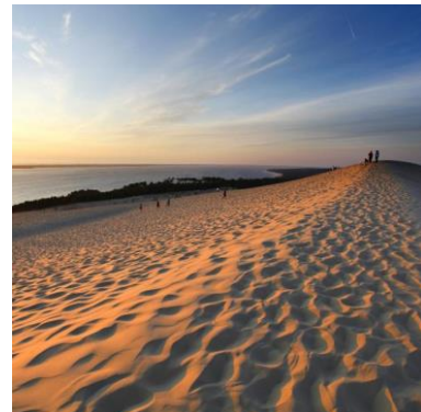
Abbildung 2 Les Dunes du Pilat