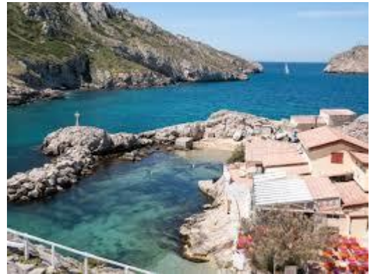
Abbildung 4 Les Calanques autour de Marseille